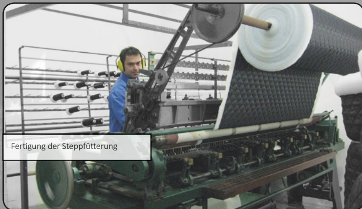
Fertigung der Steppfütterung